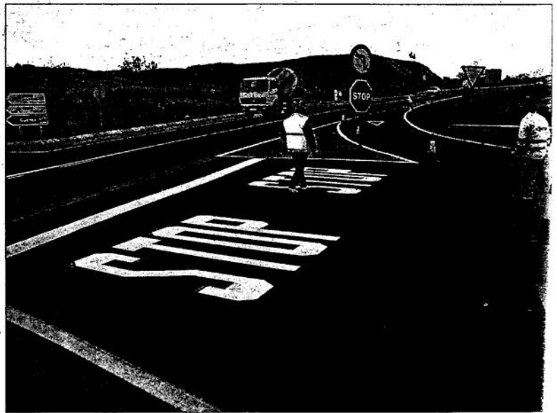
El nuevo pavimento, en color rojo, quiere llamar la atención a los conductores y evitar los siniestros. S